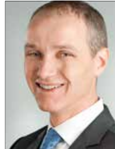
TÜV SÜD ImmoWert GmbH

Die TÜV SÜD ImmoWert bewertet Handelsimmobilien nach nationalen und internationalen Standards. Mit acht Standorten und über 40 fest angestellten Gutachtern sind wir einer der größten unabhängigen Immobilienbewertungsgesellschaften in Deutschland. Dabei kooperieren wir eng mit der BBE und der IPH. So stellen wir sicher, dass unsere Wertgutachten immer dem aktuellsten Stand der schnelllebigen Handelsbranche entsprechen. Die BBE und die IPH sind mit ihrem tiefen Handelswissen die anerkannten Experten für Handelsstandorte, Konzepte und Betriebstypen. Wir können uns bundesweit auf die Marktkenntnis unseres Partners verlassen. Unsere Zusammenarbeit ist durch eine schnelle und unkomplizierte Lieferung der benötigten Daten und Analysen zum jeweiligen Standort und Objekt gekennzeichnet.