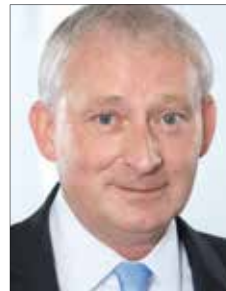
IC IMMOBILIEN GRUPPE

Die IC Immobilien Gruppe ist seit mehr als 30 Jahren einer der größten unabhängigen Full-Service-Dienstleister für gewerbliche Immobilien in Deutschland mit einem vollumfänglichen Leistungsspektrum aus Property Management, Asset Management, Projektsteuerung, Center Management, Vermietung, Investment und Fondsmanagement. Seit mehreren Jahren arbeiten wir erfolgreich mit der BBE Handelsberatung zusammen. Bislang hat uns die BBE bei diversen Projekten zum Beispiel in Magdeburg, Celle und in Eisenhüttenstadt unterstützt. Die Handelsimmobilienchecks, mit denen die Experten der BBE Handelsberatung die jeweiligen Center-Konzepte und Mieten analysiert haben, und die konkreten Optimierungsvorschläge haben uns so überzeugt, dass wir die Ansätze zur Analyse in unser neues Vermietungs- und Strategiekonzept haben einfließen lassen.